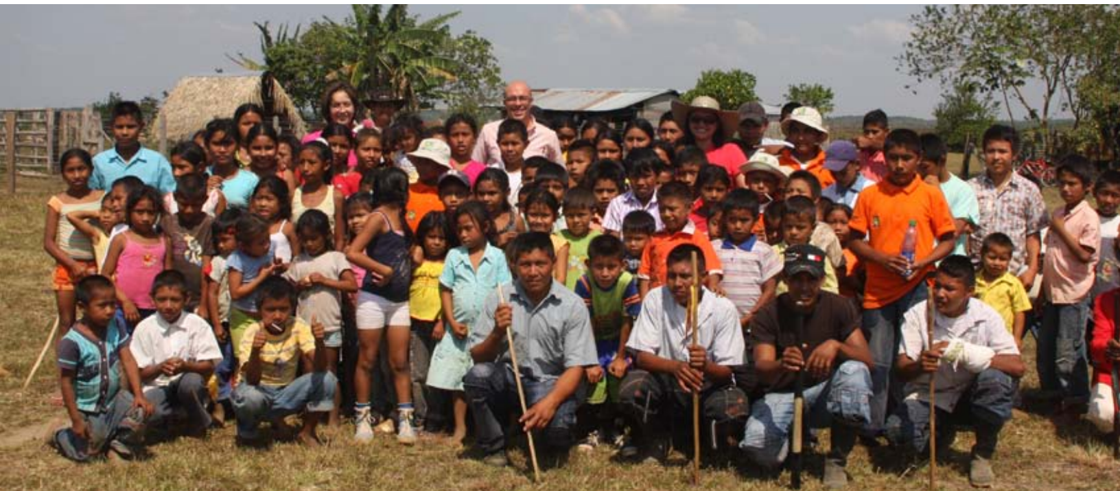
▲ Niños y niñas del Resguardo Corozal Tapajo, municipio de Puerto Gaitán,