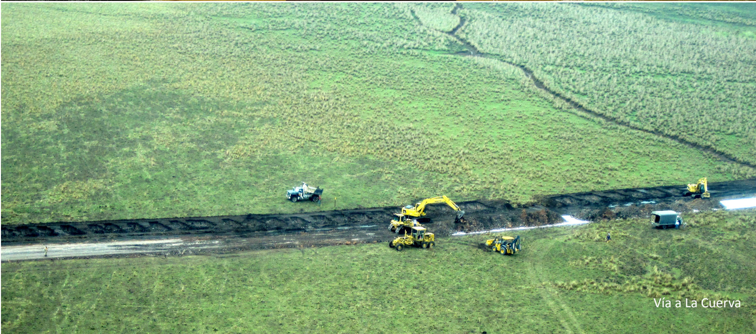
Vía a La Cuerva