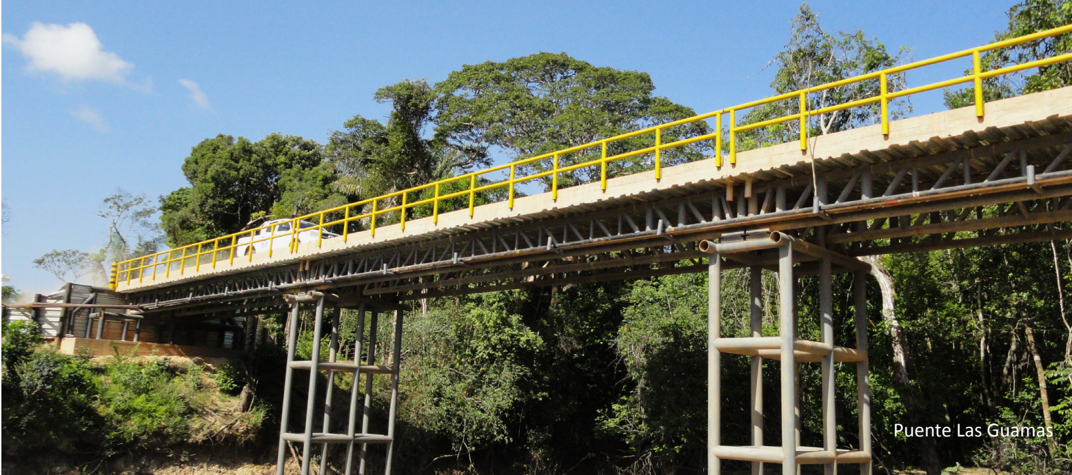
Puente Las Guamas