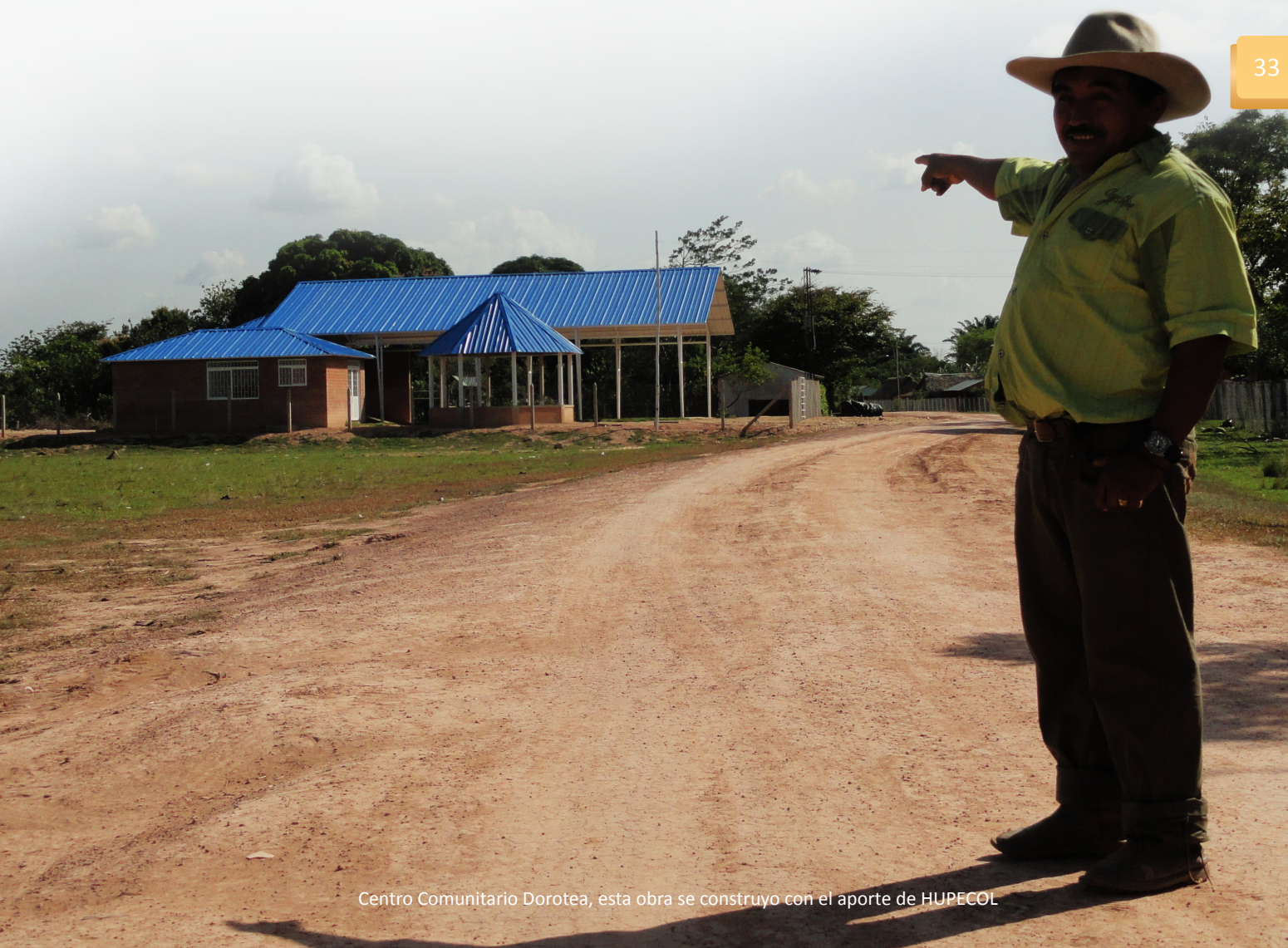
Centro Comunitario Dorotea, esta obra se construyó con el aporte de HUPECOL

El Centro Comunitario Dorotea se quedará para siempre en Centro Gaitán, este recinto será un motivo para compartir con sus familias, una excusa para volver a usar el sombrero llanero y recuperar esa costumbre ancestral y una razón para volver a las raíces del folclore y la cultura casanareña y así continuar con esa bonita esencia que tienen todos los habitantes de la región. ■