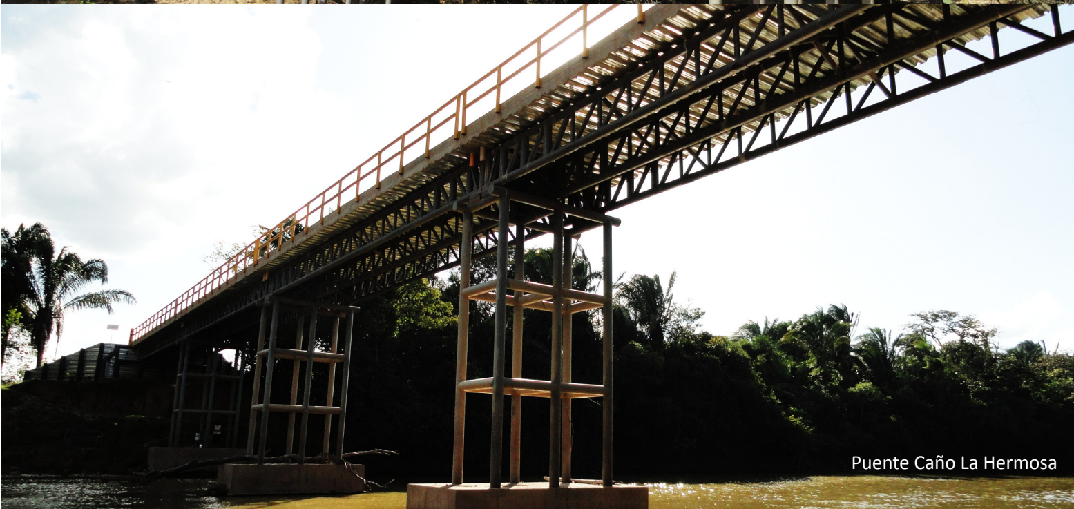
Puente Caño La Hermosa